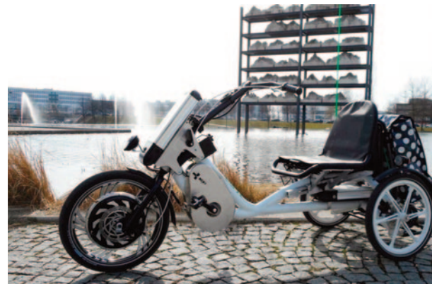
Beispiel für ein klassisches Elektro-Dreirad oder E-Trike

Nicht gefördert werden elektrische, medizinische (Kranken-) Fahrstühle, auch solche im Sinne der Krankenkassen, sowie selbstfahrende drei- und vierrädrige E-Fahrzeuge, sogenannte ‚Caddys‘.